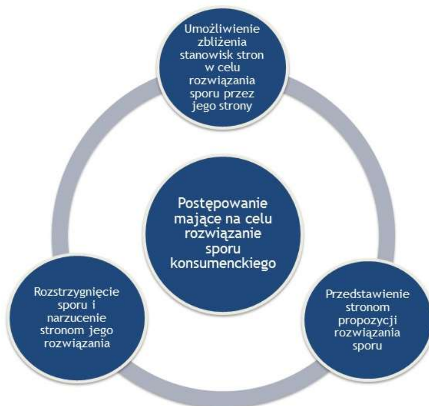
Rysunek 1. Pozasądowe metody rozwiązywania sporów konsumenckich